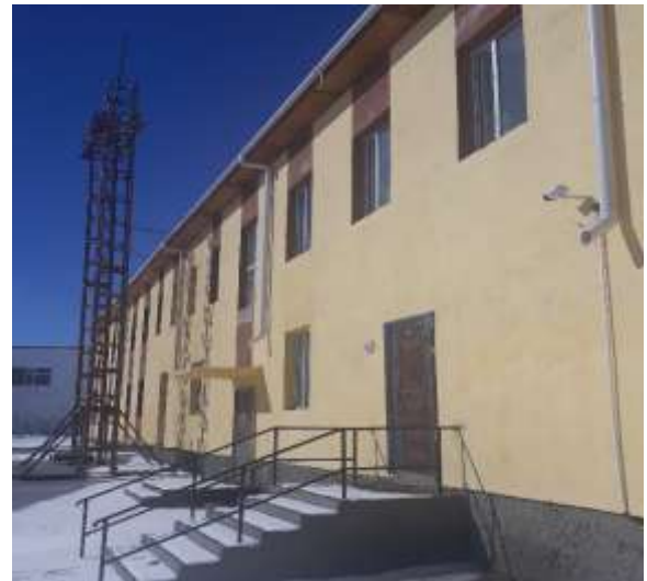
Дэлүүн сумын сургуулийн дотуур байрны барилга /73 хувийн гүйцэтгэлтэй/