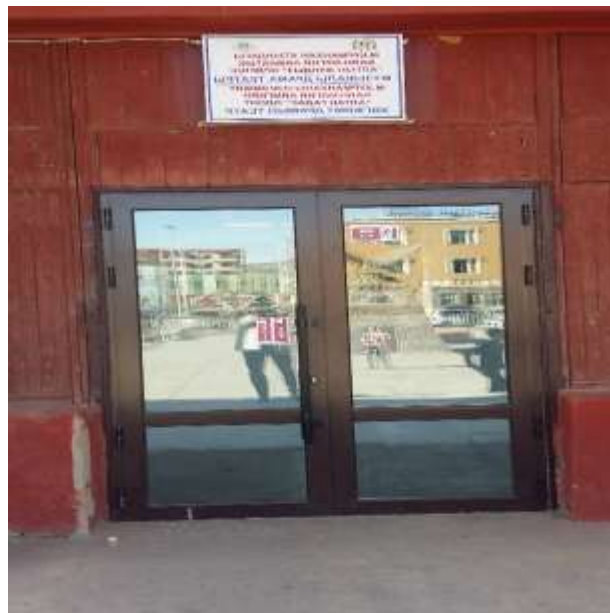
Аймгийн Хөгжимт драмын театрын засварын ажил