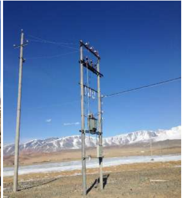
Алтай сумын Услалтын систем