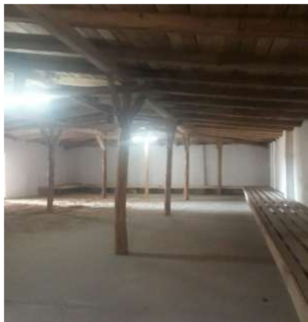
Баяннуур сумын Ногооны зоорийн барилга