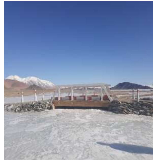
Толбо сумын Хойд, Нарийн голын модон гүүр