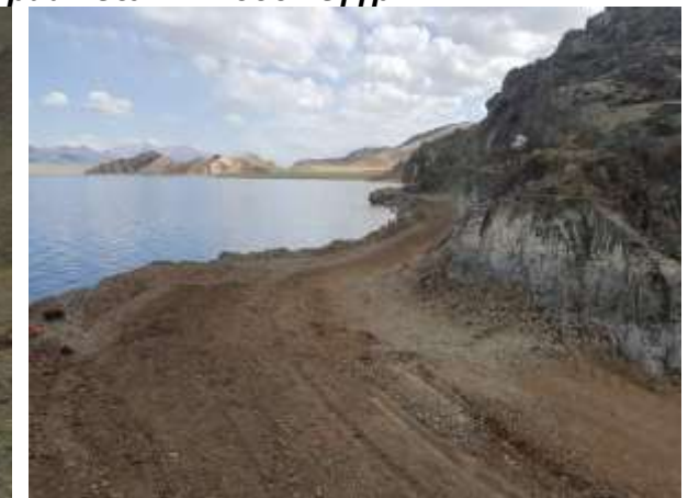
Толбо сумын Зуслангийн давааны засвар